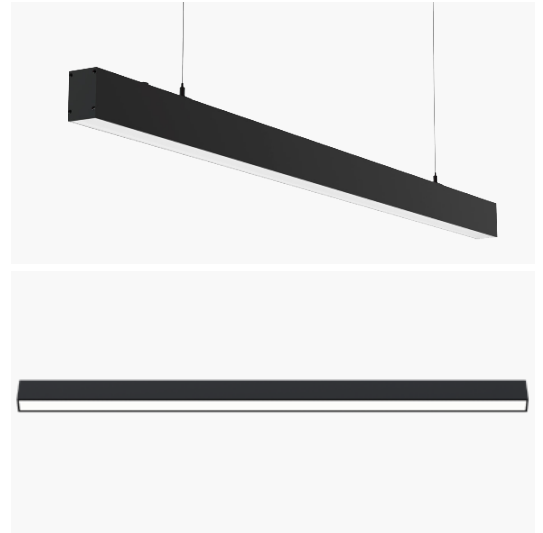
FOTO PRODUCTO. PRODUCT PICTURE