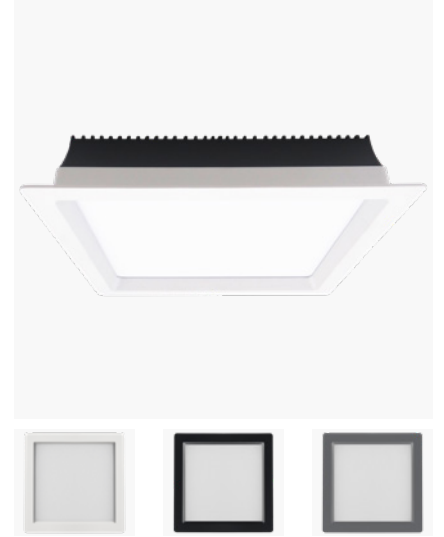
FOTO PRODUCTO. PRODUCT PICTURE